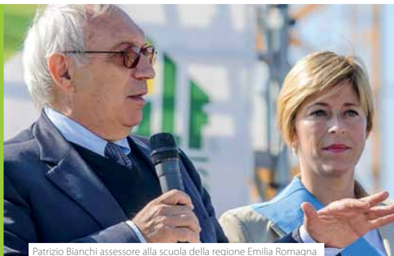
Patrizio Bianchi assessore alla scuola della regione Emilia Romagna

"Con la nuova scuola tutti noi ragazzi avremo un futuro migliore, e anche meno paura di prima per colpa di quel cavolo di terremoto."