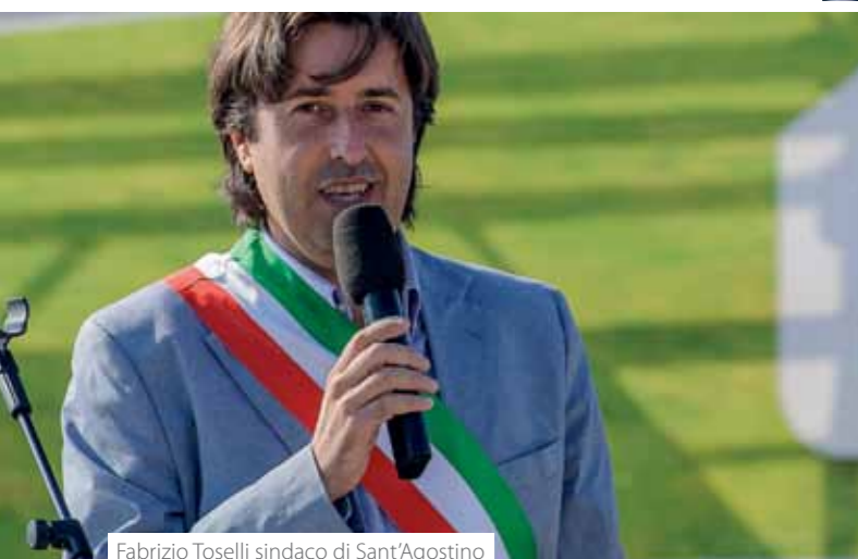
Fabrizio Toselli sindaco di Sant'Agostino