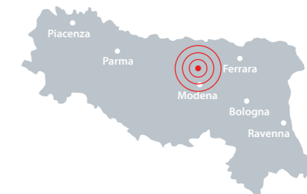
Terremoto in Emilia Romagna Magnitudo Richter: 5,9 Vittime: 27

Un cuore solo, che ha battuto tanto più forte quando un bambino ha offerto un proprio giocattolo, un pensionato i pochi euro a disposizione, e ognuno quanto ha potuto. E' da qui che bisogna ripartire: dalla voglia di sentirsi un solo popolo proprio nel momento del bisogno. Dalla solidarietà che non conosce confini, e che raccoglie tutti in un solo abbraccio che va da Vipiteno ad Agrigento, e che almeno in queste circostanze, ci rende tutti orgogliosi di essere Italiani. Un popolo capace di rialzarsi insieme, capace di guardare oltre quello che la vita quotidiana spesso non riesce a farci vedere. Su queste fondamenta, su questo vuoto riempito, sorge la nostra Scuola del Futuro.