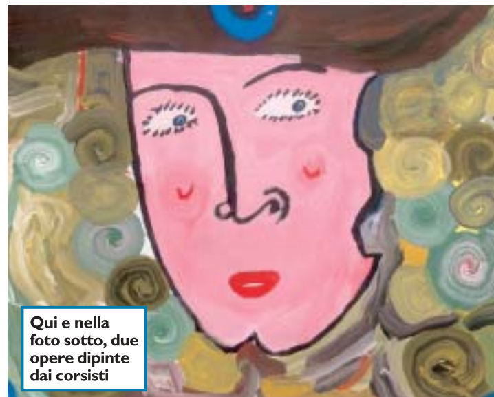
Qui e nella foto sotto, due opere dipinte dai corsisti

E' IL TRIONFO dei sentimenti: vi si possono scorgere la rabbia, l'attesa, la pietà, si possono contemplare alcuni aspetti della condizione umana, il condannato, il capitano, i prigionieri, la libertà. Pittura di emozioni, quindi, come sarà possibile cogliere con immediatezza, pittura che racconta e parla a chi cerca in un quadro le tracce di un'umanità che non può e non vuole essere perduta. Dicono i protagonisti: "Abbiamo rappresentato, come siamo stati capaci, volti famosi, visi che esprimono uno stato d'animo. Vole-